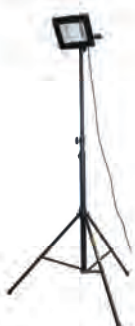
MASZT OŚWIETLENIOWY LM100AW