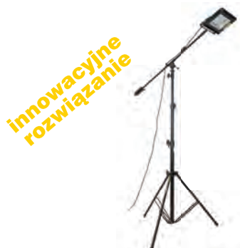
MASZT OŚWIETLENIOWY LM100AWW