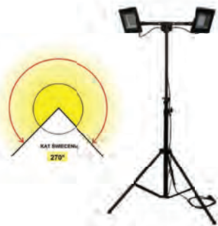
MASZT OŚWIETLENIOWY LM2x100AW